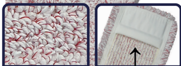
Spezielles Deckblatt 50/50